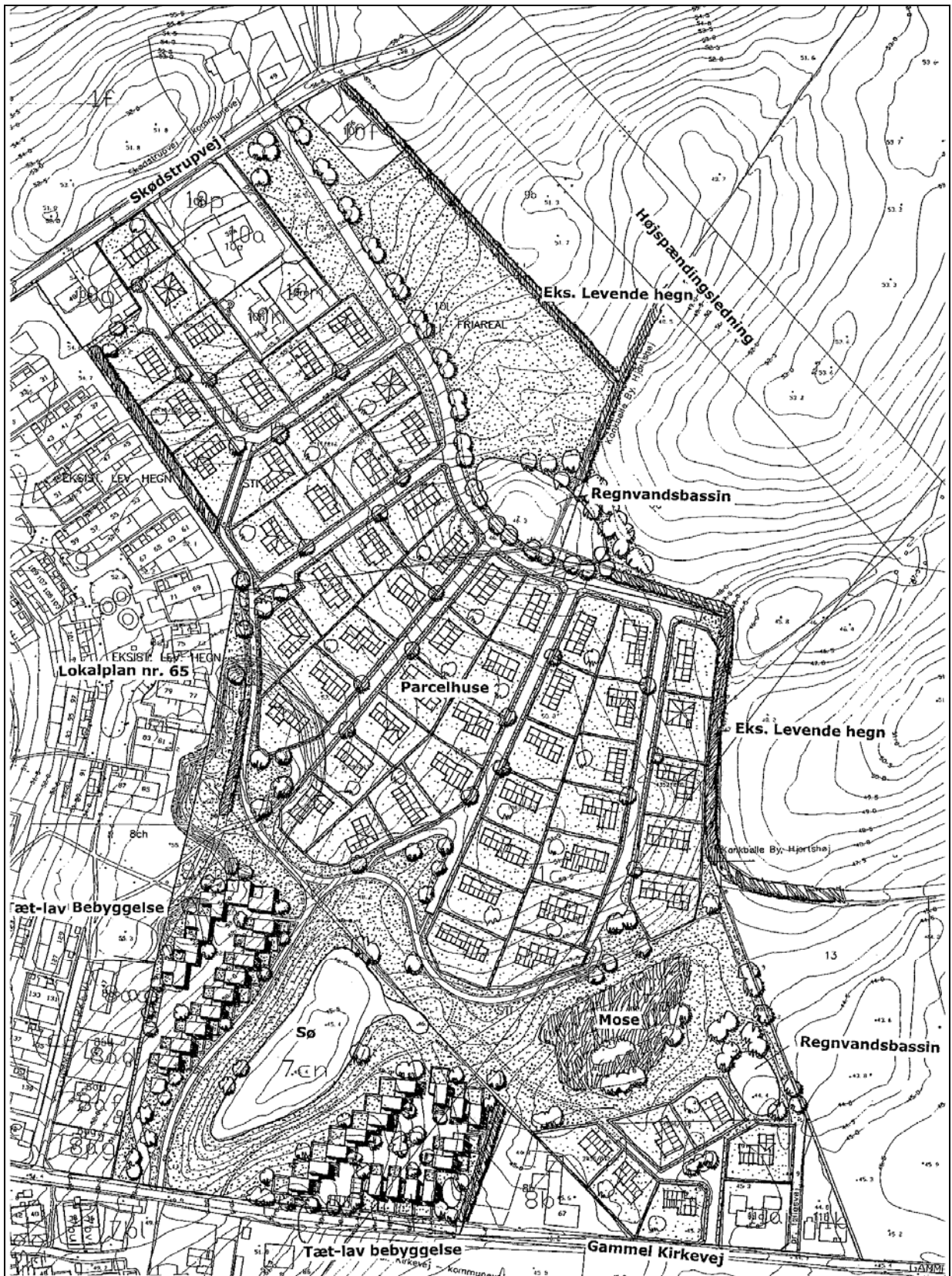
Illustrationsplan fra lokalplan nr. 809