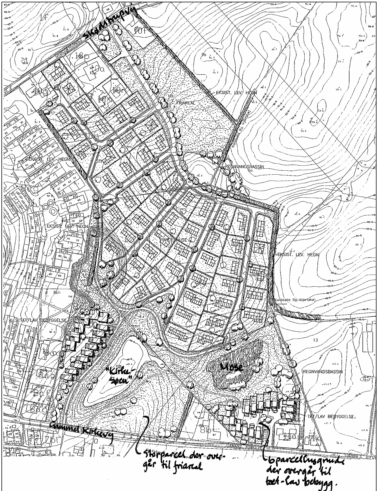
Forslag til revideret illustrationsplan