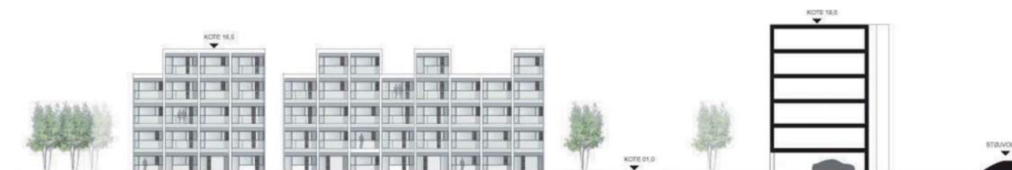
Snit i bebyggelsen - se rød markering på illustrationsplan

Et eventuelt lokalplanforslag fremlægges herefter i offentlig høring i 8 uger.