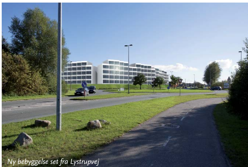
Ny bebyggelse set fra Lystrupvej