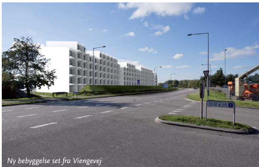
Ny bebyggelse set fra Viengevej

På grund af støjpåvirkningen fra trafik på Lystrupvej og Viengevej tænkes bebyggelsen afskærmet af et voldanlæg langs Lystrupvej og Viengevej, og bebyggelsens facader mod støjkilderne tænkes udformet med altanlignende glas-støjskærme integreret i facaden.