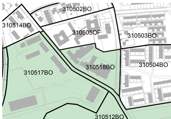
Forslag til ændring af Kommuneplan 2013

* Kategorierne i parentes henviser til kommuneplanens generelle rammebestemmelser fordelt efter anvendelseskategori.