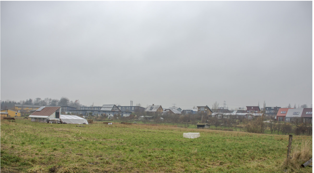
Google Streetview af Andelssamfundet Hjortshøj