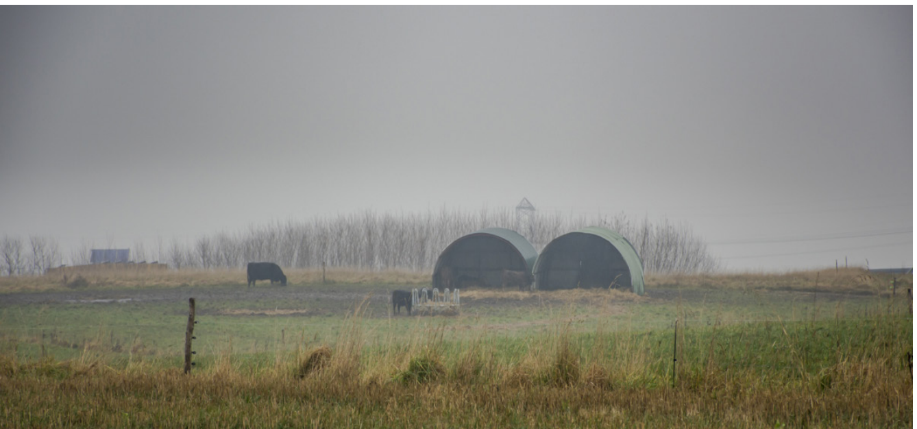
Foto af området set fra sydt

ningerne opføres i en afstand af minimum 50 meter fra byzone og den private bebyggelse. Arealet forbliver i landzone. Anvendelsen er i fuld overensstemmelse med bestemmelserne for det område arealet tilknyttes. Høringen omhandler alene en udvidelse af afgrænsningen af det eksisterende rammeområde